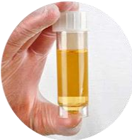
ماء سقط فيه بول